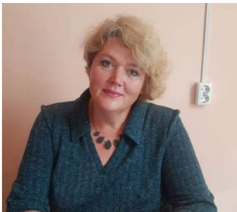
Директор МКОУ "Средняя школа №1"

Проект "Киноуроки в школах России", который реализовывает наша школа, оказался своевременным, интересным, а главное доступным и понятным нашим детям. Фильмы, которые предлагают авторы, эмоциональны, качественно сняты, в главных ролях в основном - дети. Просмотрев фильм, есть замечательная возможность совместного обсуждения увиденного, что очень ценно, потому что в процесс обсуждения включаются родители, дети, учителя и общественность. Но самым значимым в работе проекта является социальная практика, которая может быть самой разнообразной: от рисунков до работы волонтерских отрядов и значимых проектов на любом уровне. Нам предстоит большая работа в реализации этого проекта. Мы благодарны тем, кто подключился к нам и надеемся на дальнейшее сотрудничество.